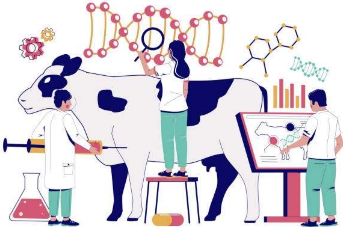
GENETICALLY MODIFIED ANIMALS